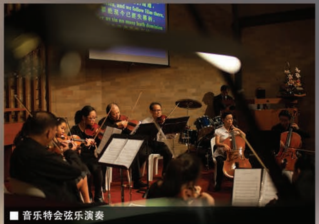
■ 音乐特会弦乐演奏