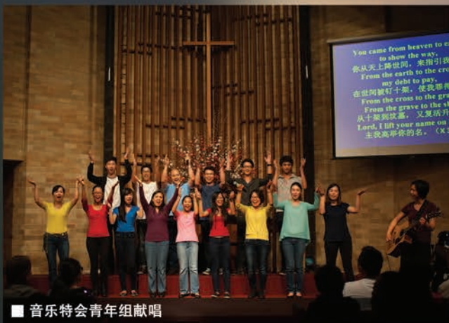
■ 音乐特会青年组献唱