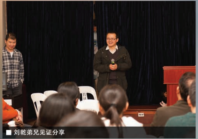
■ 刘乾弟兄见证分享