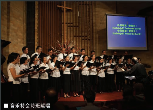
■ 音乐特会诗班献唱