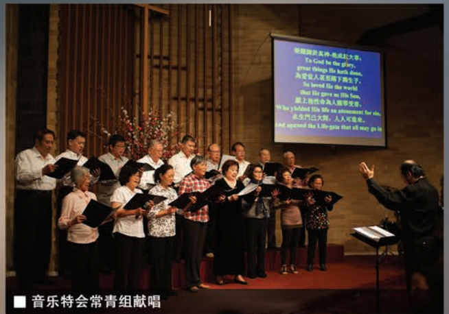
■ 音乐特会常青组献唱