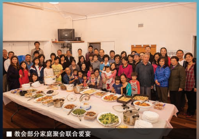
教会部分家庭聚会联合爱宴